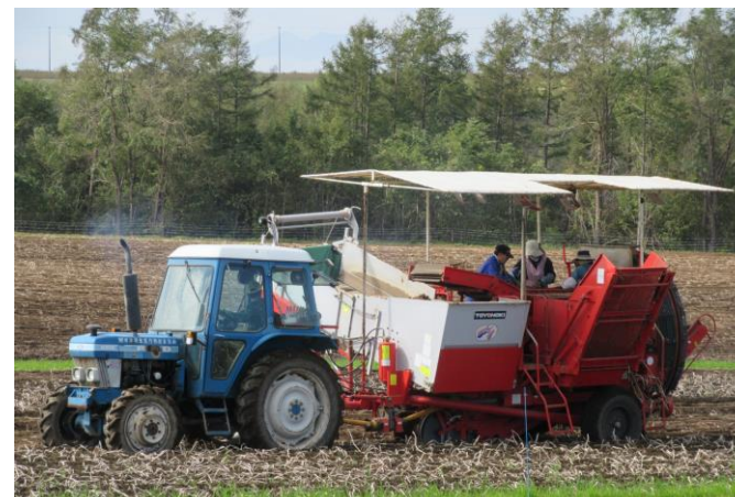
収 穫 (9月)