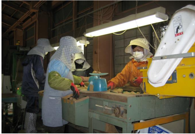
選 別 (10月)