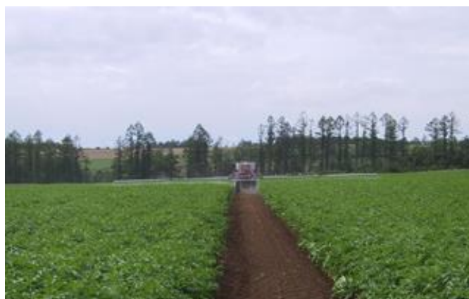
防 除 (7月)