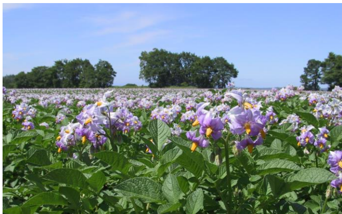
ばれいしょの花 (7月)