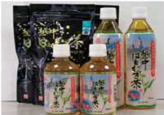
越中はと麦茶 (JA いなば)