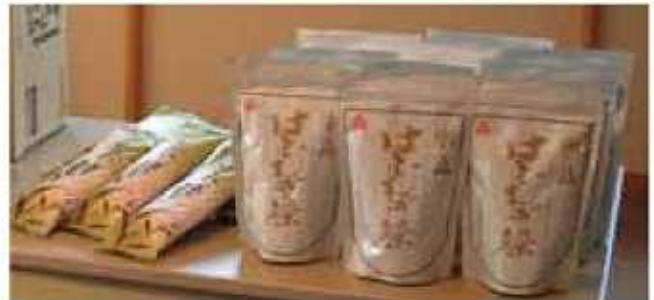
氷見はと麦茶等 (細越ハトムギ生産組合)