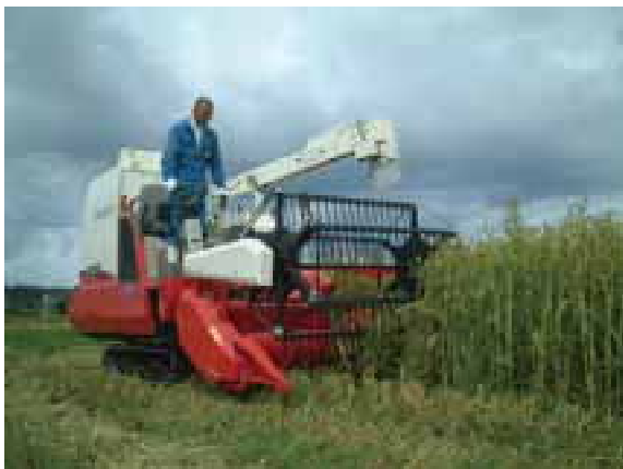
図3 収穫作業 (コンバイン)