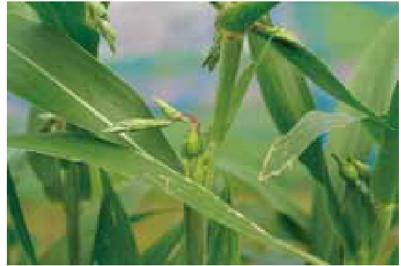
図2 ハトムギの穂 (雌しべ (赤色) が露出している)