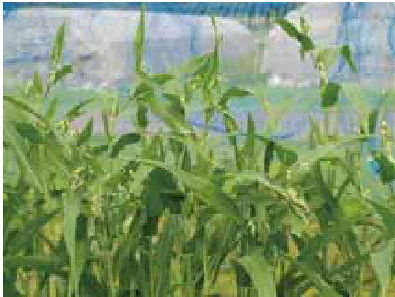
図1 穂揃い状況 (あきしずく)