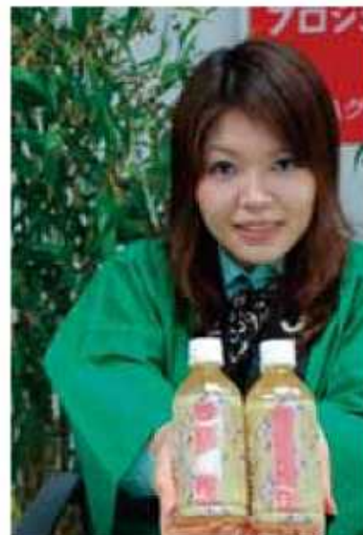
くるめ ほとめき茶 (JA みづま)